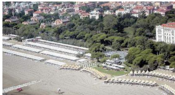
LIDO Veduta dall'alto degli stabilimenti balneari ex Ciga, una delle prime spiagge attrezzate del mondo