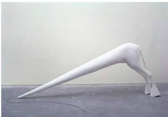
Not Vital, Il Toffus

Ci sono artisti che paiono avviare un dialogo speciale con i luoghi che ospitano le loro opere. È questo il caso di Not Vital (Sent, 1948), le cui opere sono esposte al Museo d'Arte di Mendrisio, in una mostra raffinata e densa. Il museo è collocato in un ex convento, un luogo con una luce e un silenzio particolari. Finalmente una mostra in cui non si avverte quel fastidioso senso di horror vacui che troppo spesso accompagna le nostre visite. L'artista stesso ha studiato insieme al direttore del museo, Simone Soldini, la collocazione di ogni singolo lavoro, ponendolo in relazione con opere di fattura extraeuropea della collezione permanente.