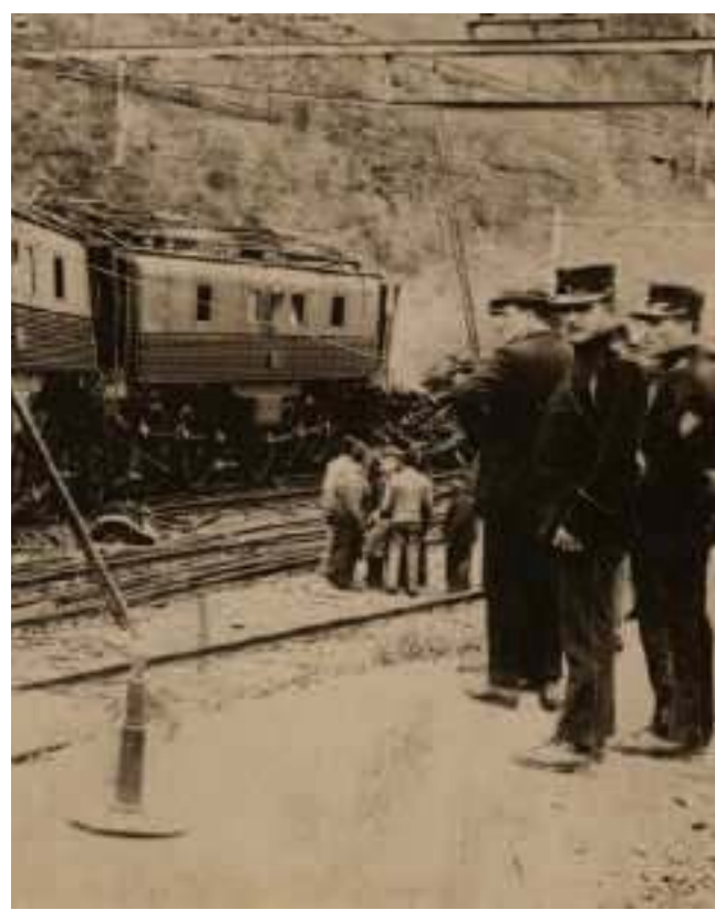
In alto una parte di scenografia. A sinistra disegno di Felice Filippini, a destra l'incidente di San Paolo del 1924