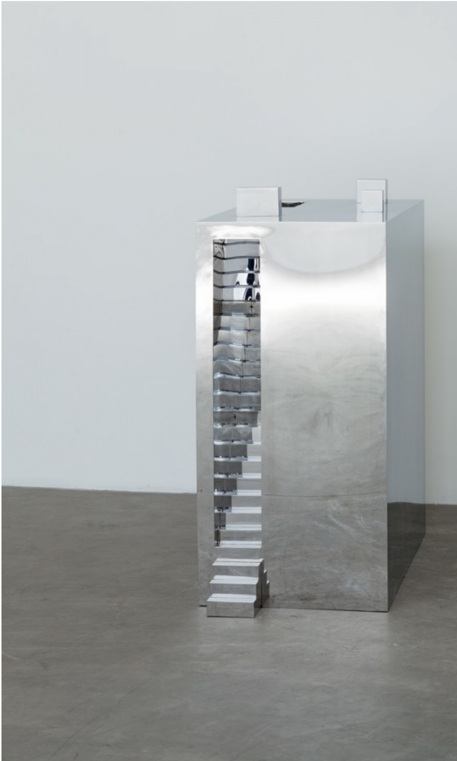
Not Vital, House to Watch the Sunset in Lamu (2013) Stainless steel

A tiny room hosts the photographic documentation of the artist's sculpture/architecture between Niger and Patagonia. Here function doesn't count if everything is about volumes, extracted or expanded. Confirmation comes from the steel model of House to Watch the Sunset in Lamu (2013). You cannot write about Not Vital without