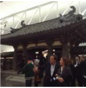
Tante immagini dall'opening di Takashi Murakami da Gagosian New York. Ovvero ricreare un tempio