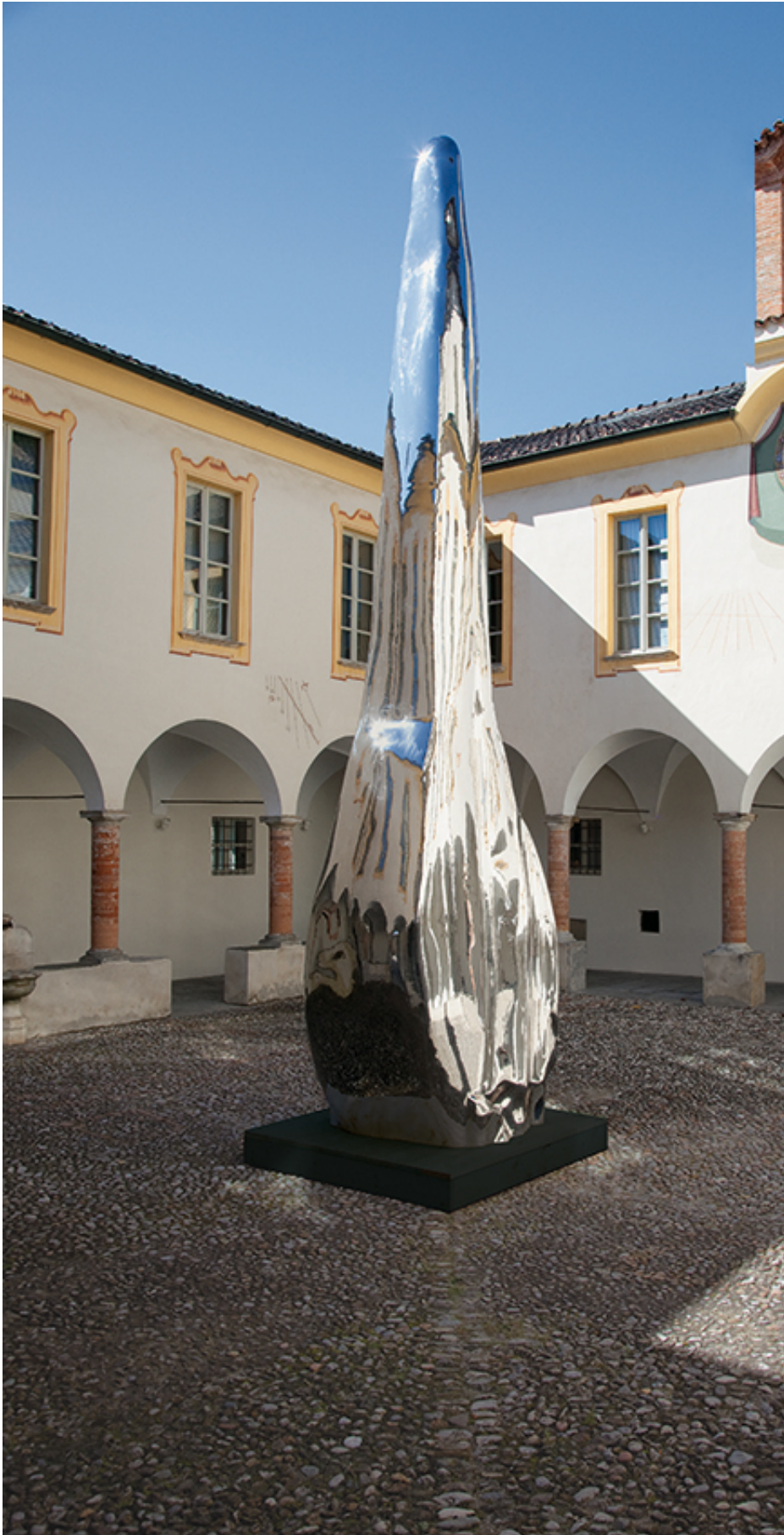
Not Vital, Tongue (2008) Stainless steel 780 cm, Photo Stefa