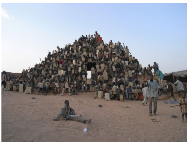
Not Vital – School

In mostra opere di diversi periodi della sua ricerca e alcune fotografie che testimoniano le sue installazioni, come quella straordinaria realizzata in Patagonia. Recenti sono le raffinate Dali Stones : nessun legame con il pittore spagnolo, il riferimento è invece a Dali, una città della Cina meridionale, il cui nome significa marmo. Tutto parte della fascinazione dell'artista grigionese nei confronti di pietre marmoree, provenienti da quel luogo, molto simili alle nostre pietre paesine che, viste in sezione, rimandano a paesaggi in bianco e nero: marine, alberi, montagne, cieli. Vital le chiude in stampi di gesso, leggermente irregolari, che fanno loro da cornice. Pare di trovarsi di fronte a schermi, in cui chi guarda è chiamato a leggere autonomamente quello che gli appare.