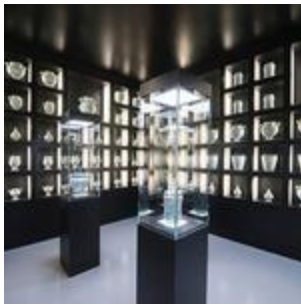
C'è anche un'Italia che le apre, le strutture culturali. Savona inaugura il Museo della ...